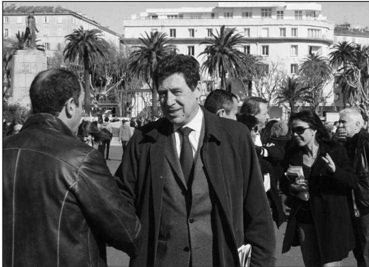
Le maire de Bastia sur le terrain, place Saint Nicolas, dans sa ville