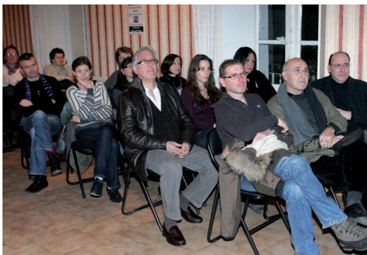
Une partie de l'assistance