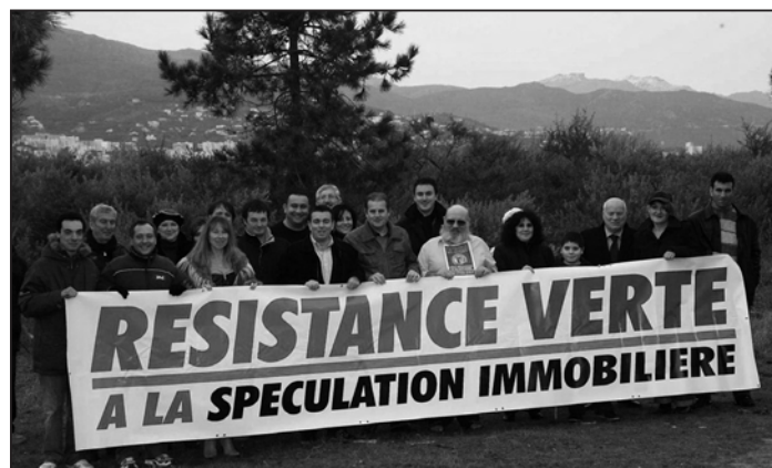
«Protégeons» la Corse n'a pas fait sienne que l'écologie insulaire

Au demeurant, nous avons conscience que si l'écologie est aujourd'hui dans tous les esprits, encore faut-il que ces derniers se libèrent de certaines contingences matérielles. On peut comprendre que les difficultés à boucler un budget fassent passer au second plan tout autre considération. L'action sociale, et à travers elle, une meilleure répartition des richesses, demeure une priorité. Il faut revenir à des valeurs saines fondées sur le respect de chacun en n'oubliant surtout pas les plus petits et les plus démunis.»