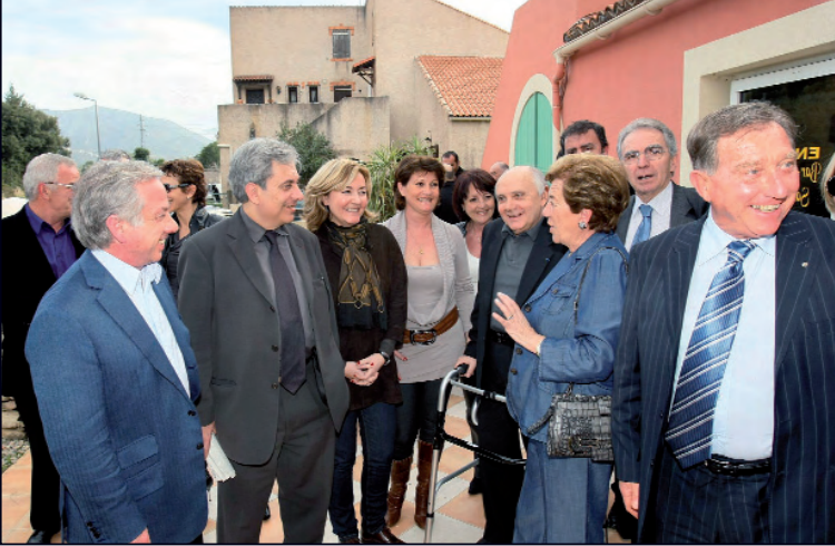
L'ÉQUIPE SORTANTE DE RASSEMBLER POUR LA CORSE

Journal du 12 au 18 mars 2010 - N° 6305 - 59 ème année