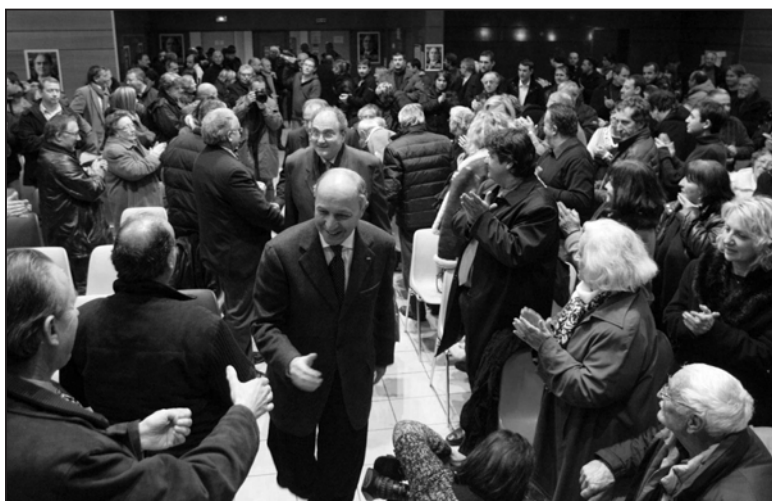
Le socialiste Laurent Fabius, venu soutenir Paul Giacobbi, le 9 mars 2010, pour un grand meeting de L'Alternance à Bastia, salle polyvalente de Lupino