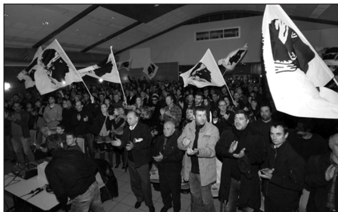
Nombreuse assistance lors du meeting de clôture de Corsica Libera, à Bastia-Lupino, le 8 mars 2010

«Nos réunions publiques ont été un succès. Manifestement, les Corses ont bien compris que la barre des 7% a été créée pour écarter notre courant du jeu institutionnel, alors que nous demeurons le dernier rempart permettant de défendre les intérêts du peuple corse. Aussi la mobilisation a été au rendez-vous.