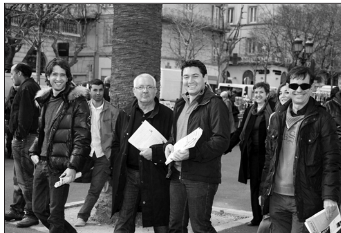
Campagne transgénérationnelle pour les autonomistes de Femu a Corsica

La question foncière est une priorité. Nous proposons 10 mesures concrètes, la plupart immédiatement applicables, allant du rétablissement des arrêtés Miot , à la défense des terres agricoles et une politique du logement pour tous.»