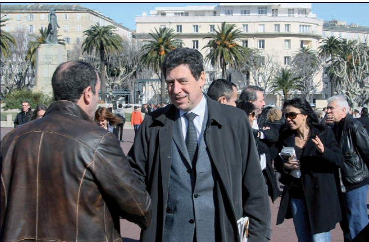
ÉMILE ZUCCARELLI DANS SON FIEF TOUT À LA GAUCHE RÉPUBLICAINE